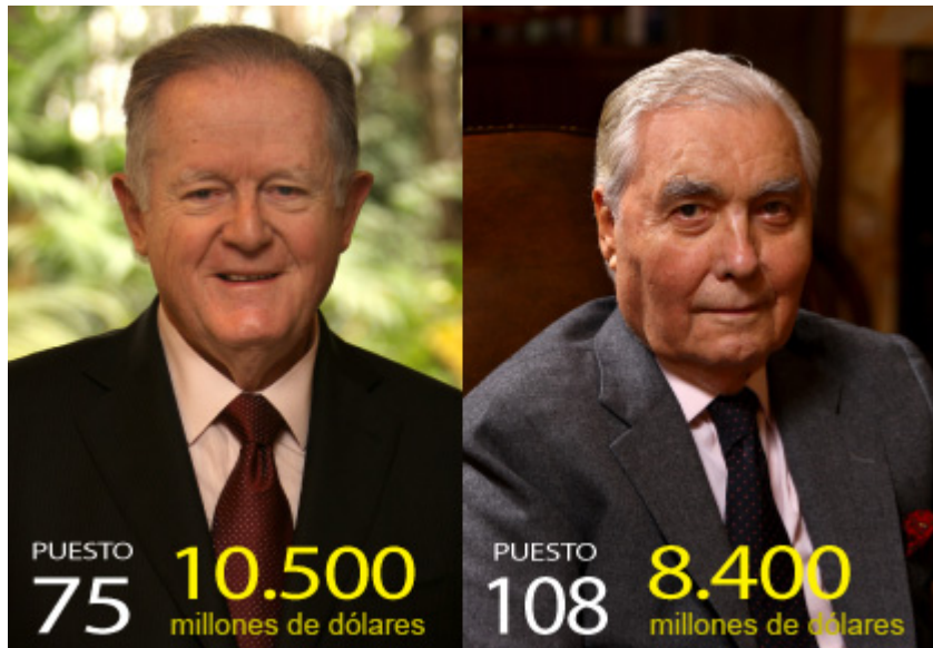
Luis Carlos Sarmiento Angulo - Julio Mario Santo Domingo